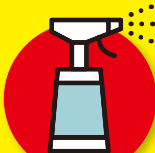
空間や物の 消毒・除菌